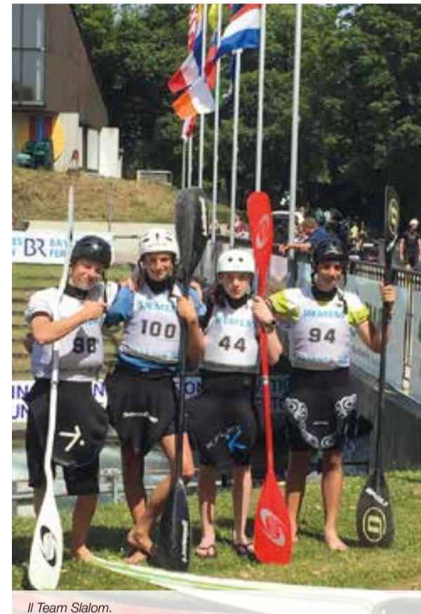
Il Team Slalom.